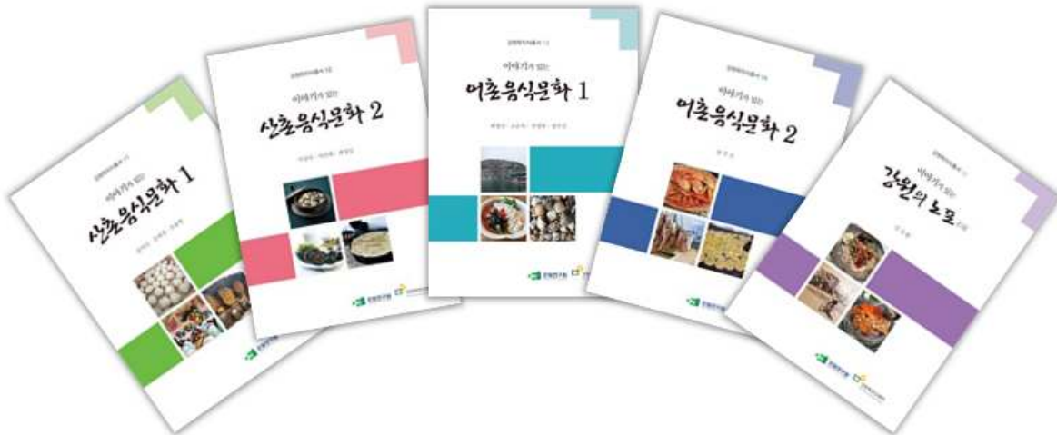
강원학 지식총서 11~15 '이야기가 있는 강원도의 음식문화'