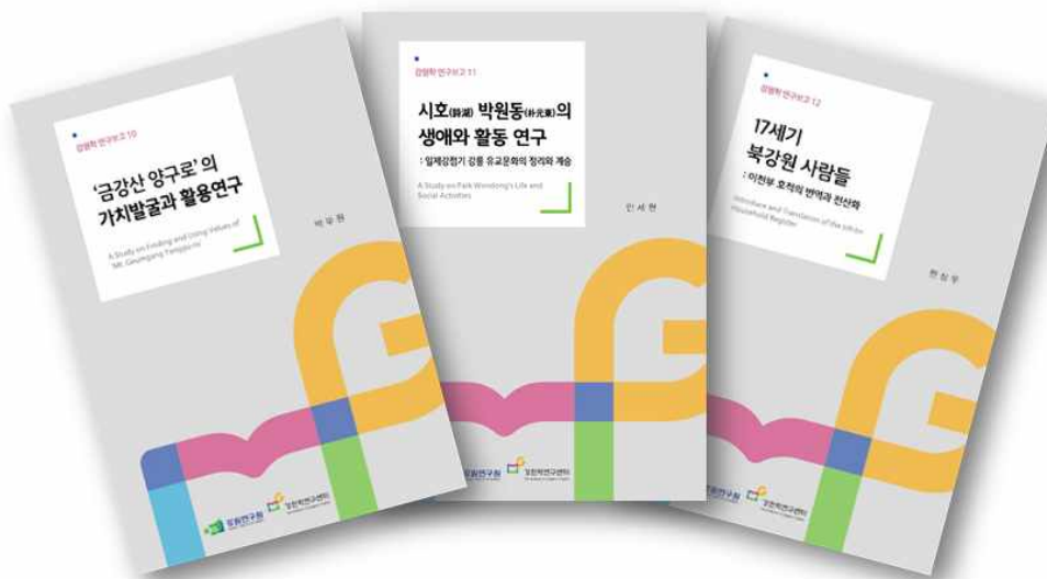
강원학 연구보고 10 · 11 · 12